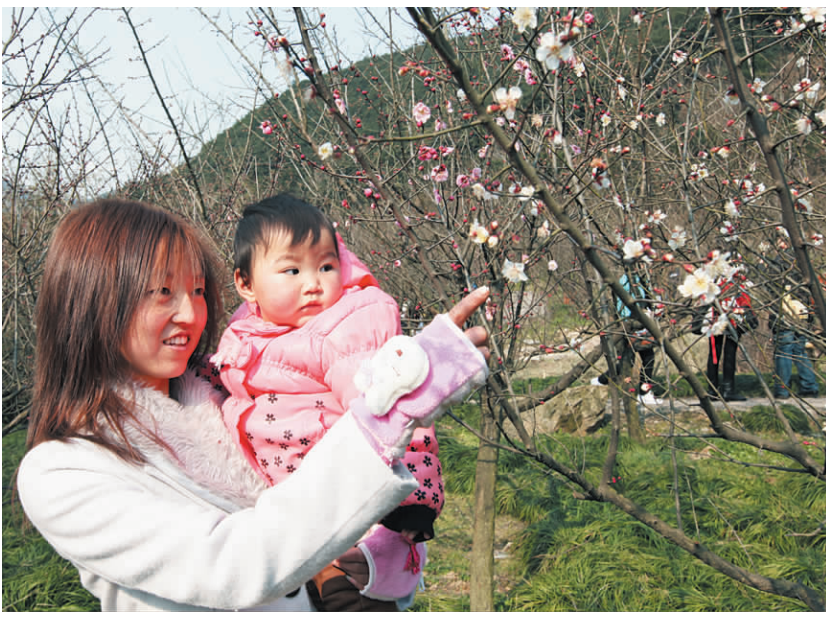
图为市民在赏梅。

本报讯(记者 龚雯雯)2月19日,北仑九峰山下,春意盎然,梅花竞相开放。由区旅游局、区体育局、大碇街道办事处主办的2012年九峰山梅花节暨万人健康休闲登山活动启动仪式,在九峰山景区广场举行。副区长刘文科出席仪式并宣布开幕。活动现场,锣鼓喧天、人声鼎沸。舞龙、腰鼓、拉丁舞、瑜伽……各类文艺表演轮番上阵,引得周围群众赞叹声不断。“我是江西人,以前没看过这个,很有意思啊。”宁波大学大三学生小刘指着舞龙表演颇为兴奋,“我要多拍些照,回去给同学看”。